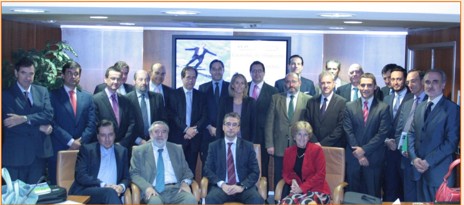
Algunos miembros del Foro ECOFIN junto a los directivos de las principales Escuelas de Negocio españolas que participaron en el debate.

Tecnología e internacionalización abren las puertas a un nuevo desarrollo de las escuelas de negocio españolas, frente a la contracción de la demanda interna y la necesaria concentración de oferta formativa de postgrado y, también, de instituciones. Sólo la colaboración mutua puede encontrar salidas en los pocos frentes comunes abiertos ante la Administración española y europea de Educación, las fórmulas compartidas de oferta conjunta al exterior y la necesaria dotación tecnológica de nuestras escuelas. O eso es lo que proponen una veintena de directivos de escuelas de negocio privadas, públicas, de universidades o independientes reunidos por ECOFIN y AEEN en la sede de CEOE la pasada semana.