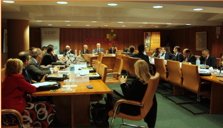
El encuentro se celebró en la sede de CEOE-CEIM el 6 de noviembre.

6º) Hay que estar atentos a lo que ocurre en nuestro entorno europeo. En el caso de Francia se ha iniciado un proceso de concentración empresarial y fusión entre escuelas que llegará a España, porque para competir internacionalmente se requiere una masa crítica mínima, que obviamente puede adquirirse con acuerdos estratégicos y fusiones, adquisiciones, etc.