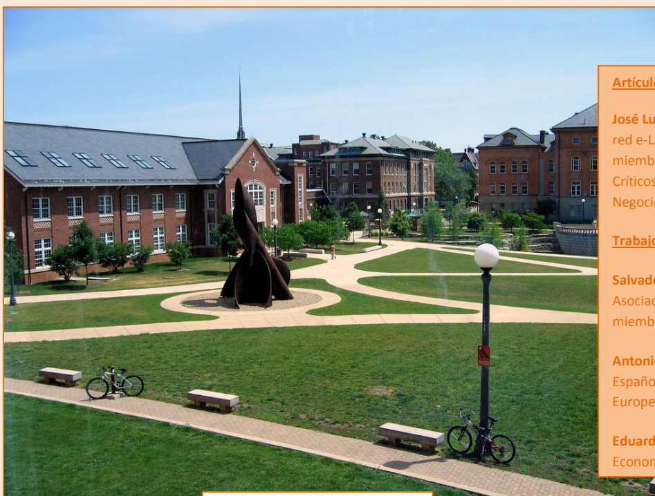
El campus de la Universidad de Illinois.

El recorrido por algunas escuelas de negocio líderes en el mundo muestra el camino a seguir. No se sorprenda el lector de que volvemos a entrar en territorio norteamericano. Es que en esta materia son los líderes mundiales. Sostuvimos en nuestro análisis 'Hacia un nuevo paradigma en la formación de postgrado' ( http://ecofin.es/actualidad/hacia-un-nuevo-paradigma-en-la-formacion-de-postgrado/ ) que tiene que haber una decisiva y rápida implicación de las escuelas de negocio en el ámbito político. Veamos ahora nuevas áreas de reflexión.