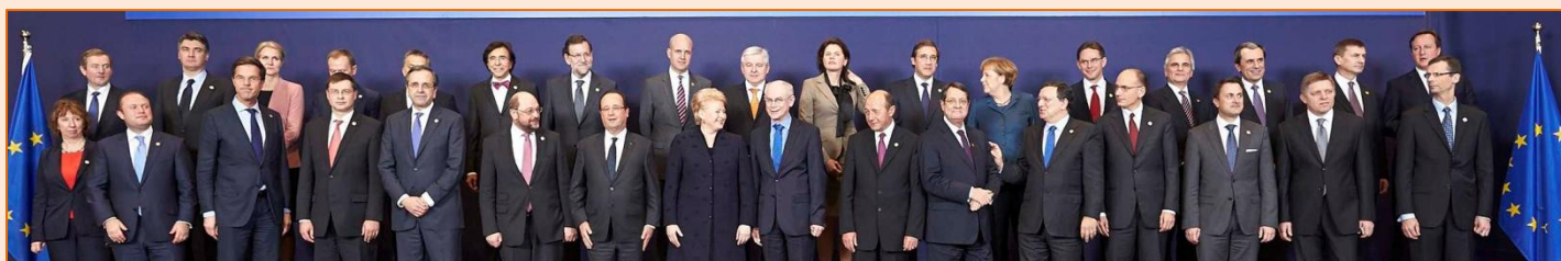
Los jefes de Estado y los jefes de Gobierno de los 28 países miembros de la Unión Europea ratificaron el 20 de diciembre el acuerdo alcanzado para crear un mecanismo único de liquidación de bancos en crisis.

ECOFIN reservará un papel central a los expertos que hablarán del nuevo horizonte financiero europeo con la nueva Zona Única de Pagos (SEPA) y la Unión Bancaria Europea en la agenda 2014.